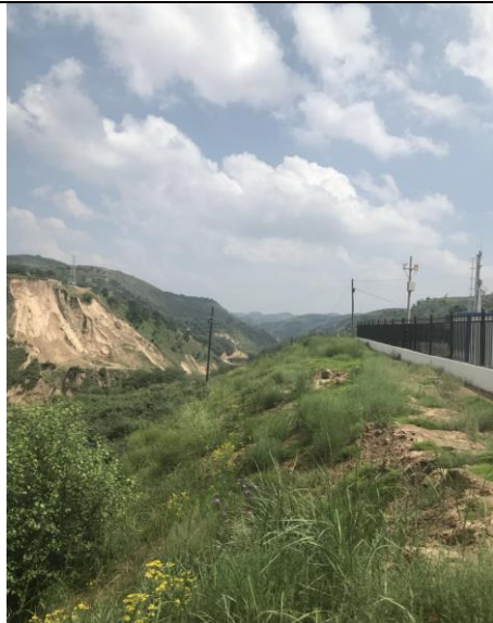
临时占用荒草地恢复情况