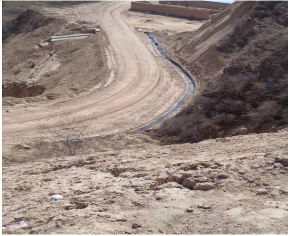
进场道路雨水导排渠