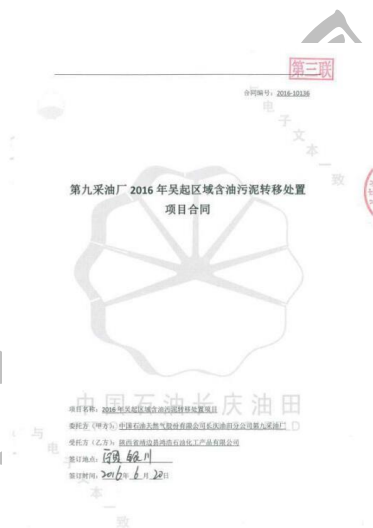
危险废物处置协议