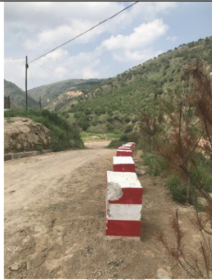
油区道路恢复情况