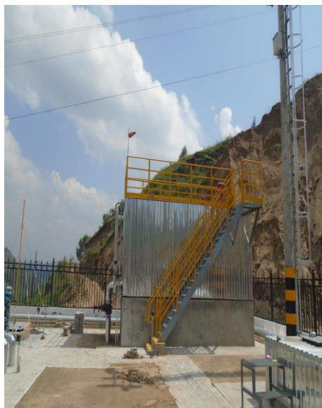
1 具投产作业箱（应急事故池）

运营期无生产废水产生；站区设有 1 具 30m 3 投产作业箱（应急事故池）；环评阶段本站无无人值守增压站，实际现场勘察时沟通，站区有 3 名劳动定员，每班 2 人，员工如厕废水排入站区旱厕，由农户定期清掏，不会对环境产生影响。