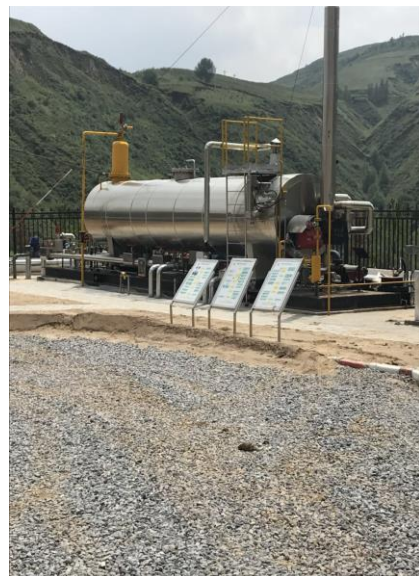
1台水套加热炉（排气筒高度8m）